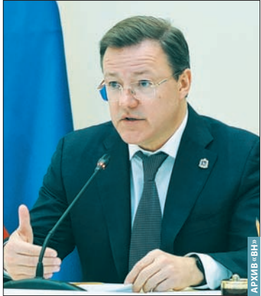
ДМИТРИЙ АЗАРОВ, ГУБЕРНАТОР САМАРСКОЙ ОБЛАСТИ:

«ОБЕСПЕЧЕНИЕ ПОСЕВНЫМ МАТЕРИАЛОМ АГРАРИЕВ - ЗАДАЧА НЕ МЕНЕЕ ВАЖНАЯ, ЧЕМ ТЕХНОЛОГИЧЕСКИЙ СУВЕРЕНИТЕТ»