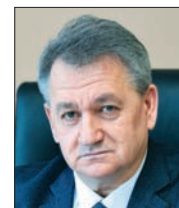
НИКОЛАЙ АБАШИН, МИНИСТР СЕЛЬСКОГО ХОЗЯЙСТВА И ПРОДОВОЛЬСТВИЯ САМАРСКОЙ ОБЛАСТИ:

- На развитие растениеводства региона в текущем году будет направлено 1,2 млрд рублей из областного и федерального бюджетов. 75% этих средств уже доведены до получателей. Кроме того, сельхозпроизводители губернии активно используют механизм льготного кредитования. На текущий момент Минсельхозом России одобрено 243 заявки на приобретение материальных ресурсов для растениеводства на общую сумму 6,61 млрд рублей.